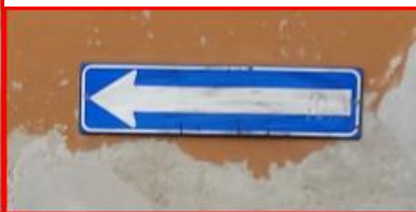
via tozzoni via manin