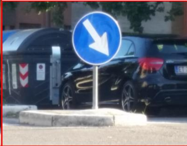
via zappi via macchiavelli